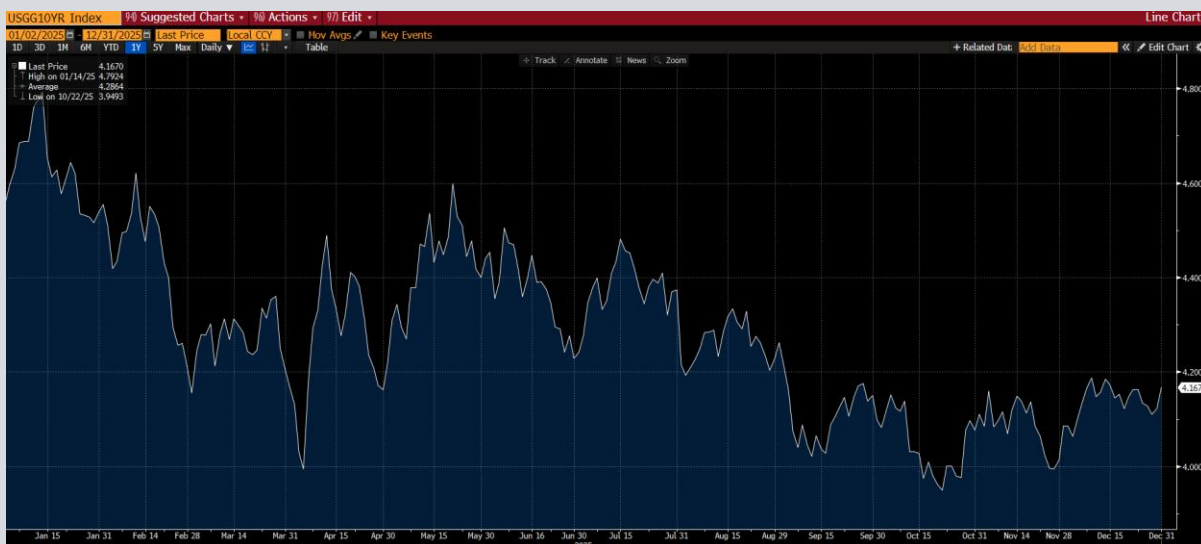
US 10 år – Amerikanska 10 års ränta, 12 månader, 2025-12-31

I Sverige valde Riksbanken att hålla reporäntan oförändrad på 1,75 % under kvartalet. Inflationen fortsatte att utvecklas i linje med prognoserna, samtidigt som konjunktursignalerna var blandade. De längre svenska räntorna sjönk något mot slutet av året, vilket speglar förväntningar om en stabil penningpolitik under 2026. Kreditmarknaden fortsatte att stärkas, med god efterfrågan på svenska räntebärande placeringar och fortsatt attraktiva riskpremier.