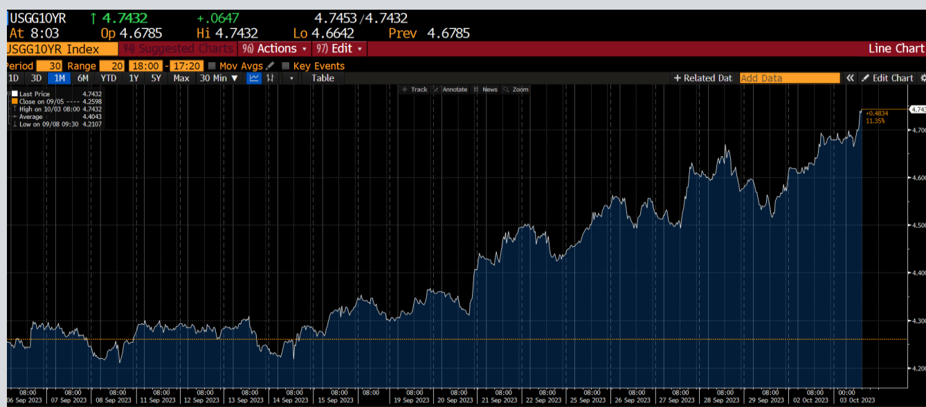
US 10 År- Amerikanska 10 års räntan, 1 månad, September 2023. Bloomberg

Under detta kvartal har det varit händelserikt om man tittar på marknadsräntorna. Under augusti månad steg den amerikanska 10-åriga marknadsräntan till 4,35 %, den högsta nivån sedan 2007. Denna höga räntenivån förklaras framför allt av ett ökat utbud från FED (Federal Reserve System) och ökat upplåningsbehov tillsammans med en nedgradering av det amerikanska kreditbetyget. Efter elva räntehöjningar i rad meddelade FED på senaste räntemötet den 21 september att man pausar och låter räntan ligga oförändrad. Räntan ligger för närvarande på 5,25-5,50 procent, som är den högsta nivån på 22 år. Samtidigt fick man en indikation att det troligtvis blir ytterligare en höjning senare i år. Tillväxten i USA trummar på och även om arbetsmarknaden visat lite svagheter senaste månaderna ser det på det stora hela stabilt ut för de amerikanska hushållen.